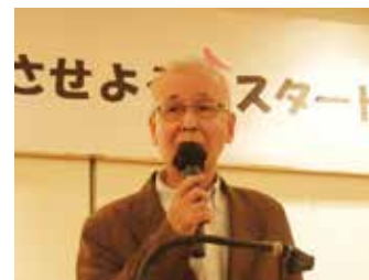
女性のリーダーを実現させようと、決意を述べる福石共同代表